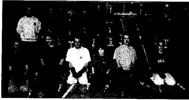
L'effectif kendo du JCN