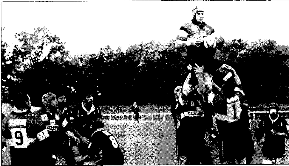
Les Nazairiens ont été dominateurs en touche à Poitiers